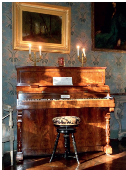
DOMAINE GEORGE SAND