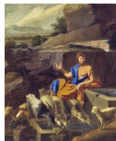
Jean Tassel, Le buisson Ardent (détail), Huile sur toile, XVII e siècle, © Musée GSVN