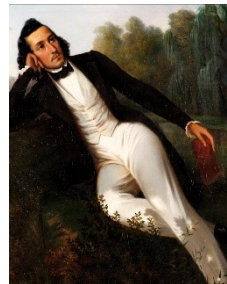
Alcide Boichard, Ernest Périgois (détail), Huile sur toile, 1846, © CO Darré