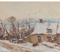
Fernand Maillaud, Verneuil sous la neige, Huile sur toile début XX e siècle © CO DARRÉ

Visite de l'exposition : dimanche 27 septembre à 16h (compris dans le prix d'entrée)