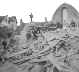
Effondrement de l'église de La Châtre, 1896

Tel un historien, fouillez et revivez l'événement, comme si vous y étiez !