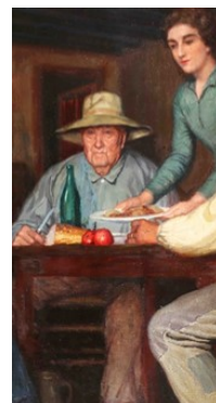
Vicente Santaolaria, Le repas berrichon (détail) , Huile sur toile, début XX e siècle © CO Daré

au 02 54 48 36 79 ou musee@mairie-lachatre.fr