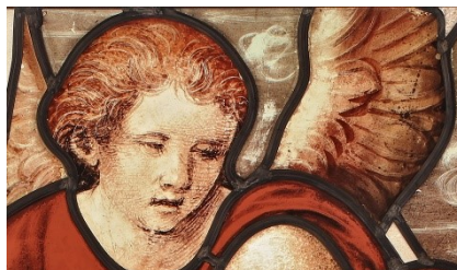
Jean Lécuyer, Vitraux du Martyre de Saint Vincent, (détails), 1550, © CO Darré