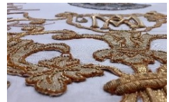
Bannière de la Vierge Chasuble de forme gothique , (détails), fin XIX e siècle