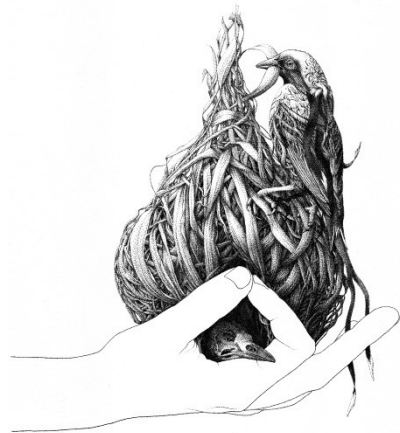
Alexandre PALEZIS Le retiqueire tressé du Tisserin coiffé 2023, Encre de Chine sur papier