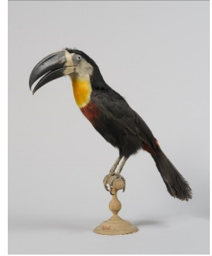
Toucan Ariel XIX e siècle, Guyane, spécimen naturalisé

Le musée a choisi de mettre en lumière une sélection de spécimens de sa collection ornithologique : au total 2480 spécimens des XVIII e et XIX e siècles, provenant de tous les continents, en partie rapportés lors d'expéditions scientifiques. L'exposition aborde les grandes collections scientifiques du XIX e siècle, à travers les figures d'Emmanuel (1742-1801) et François (1778-1855) BAILLON, qui ont constitué cet ensemble unique. La collection, par sa fragilité et la présence d'espèces menacées et éteintes, interroge notre rapport contemporain à la nature et son impact sur elle, plus de deux siècles après sa constitution.