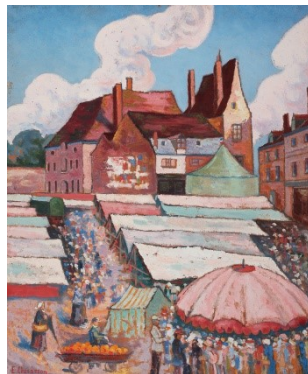
Eugène CHARASSON Marché de la Châtre Huile sur toile, 1939

Réalisé en partenariat avec le centre d'interprétation des peintres de la Vallée de la Creuse-Hôtel Lépinat qui présente le second volet de l'exposition en 2024 et 2025 et grâce aux prêts de la famille du peintre et du musée Bertrand à Châteauroux.