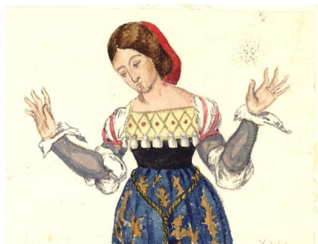
Maurice SAND Illustration d'un costume du XVI e siècle, Gouache et aquarelle sur papier, XIX e siècle

Le musée a acheté par préemption, en 2023, un ensemble tout à fait inédit et exceptionnel de près de 4 000 dessins de la main de Maurice SAND (1823-1889). Ces dessins, retracent tout un pan de l'histoire du vêtement : de l'Antiquité à la fin du XIX e siècle, de façon chronologique.