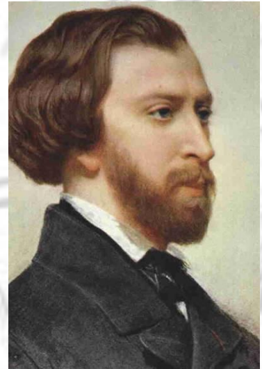
Alfred de Musset